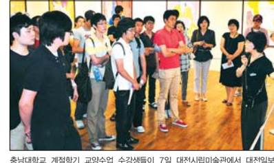
충남대학교 계절학기 교양수업 수강생들이 7일 대전시립미술관에서 대전일보 등이 주최하는 '모네에서 윌헬름까지'전을 관람하고 있다.

전 세계 20개국의 한국학 전문가들이 한자리에 모여 한국학 연구의 현황을 점검하고 발전 방향을 모색하는 학술대회가 7일 개막했다. 한국국제교류재단은 창립 20주년을 맞아 해외 한국학자 90여명과 국내 학계가 100여명을 초청, 9일까지 서예 중구 롯데호텔에서 '2011 한국국제교류재단 어셈블리(Assembly)'를 개최한다.